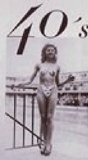
El primer bikini centro se presentó en 1946. Fue la bañista Micheline Bernardini la que puso con este bikini, considerada tan exclusiva como la bomba lanzada por EEUU en las islas Bikini, de ahí su nombre. Triumph Internacional lo recreó en un dos piezas de punto de algodón.