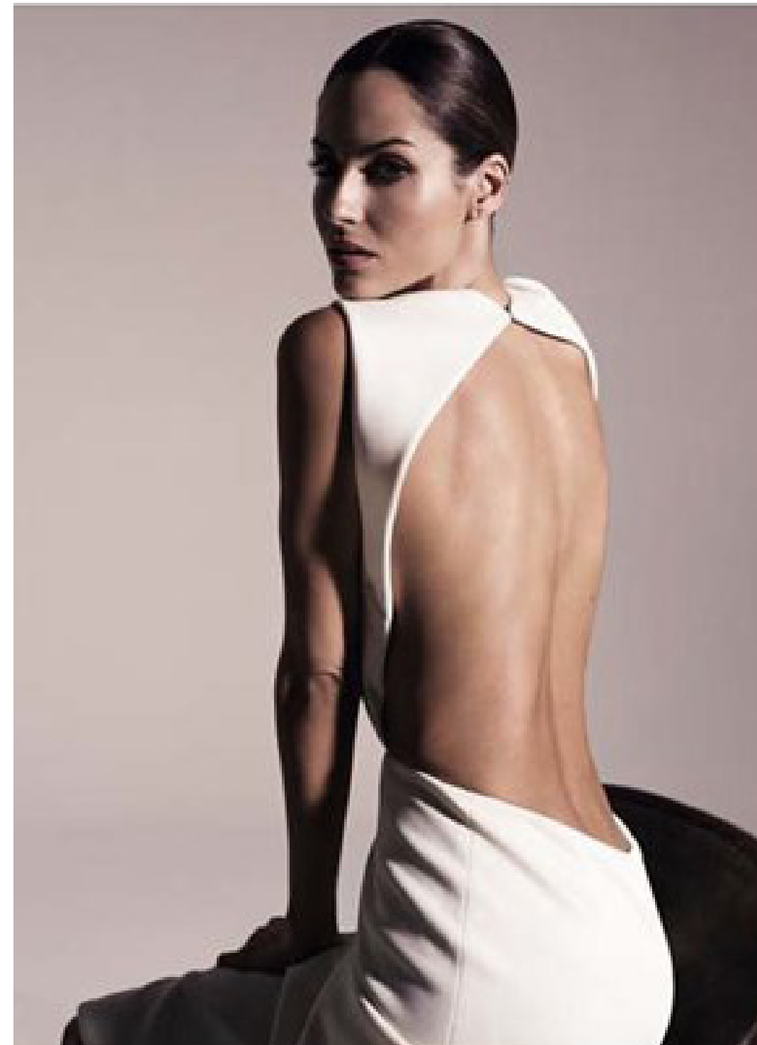
Ariadne Artiles con vestido de espalda descubierta, de The 2nd Skin Co.

«Quienes tenemos el privilegio de poder ayudar a los otros hemos de hacerlo, lo siento casi como una obligación.»