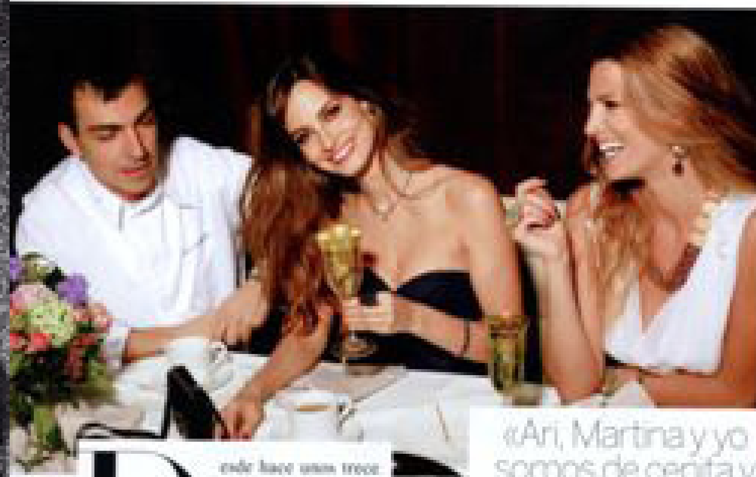
TRÍO DE ASES Ari, de Oscar de la Renta; bolso de Hermes; y joyas de Rabot. Laura, de Escada; bolso de Bottegavola; pulsera, collar y anillo de Bourlaít para Matic; reloj de Rolex; y pendientes de Foggi para Fabiana. Copas de Romano; centro de mesa de Durán; y fono de The Workshop.