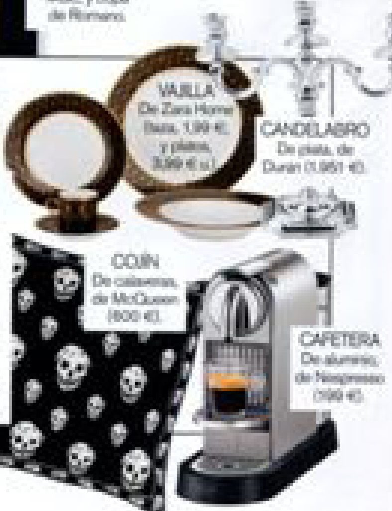
VALLA De Zana Home (base, 1,99 €; y platos, 3,99 € c/u).