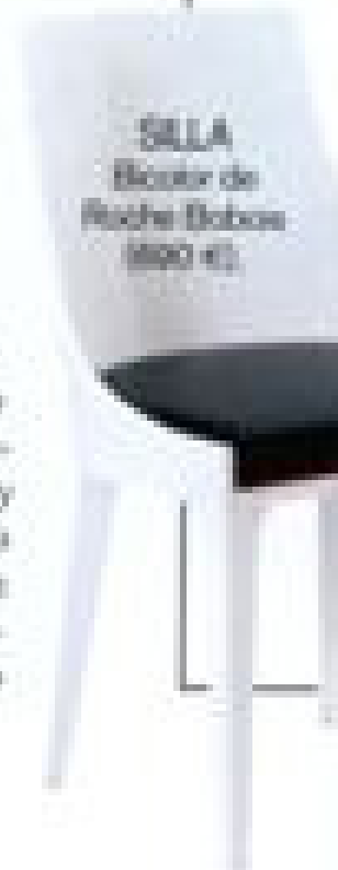
SILLA Bocle de Roche Bobois (800 €).

AMBIENTE «Fongo vesis, buéalo los puntos de luz y convócalo media hora antes para empezar en la cocina, con vino y canapé, mientras yo acobos», dice Laura.