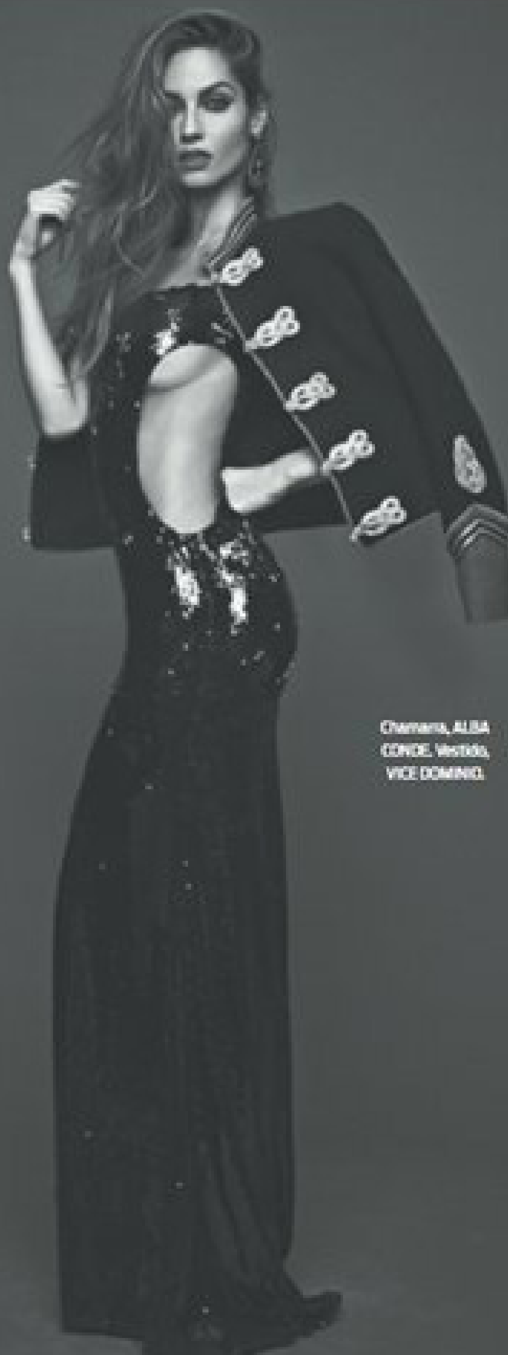
Chemera, ALBA CONCE. MESTRO, VICE DOMINGO.

AA A todas aquellas que se las ingenian para ser grandes empresarias, mujeres y madres a la