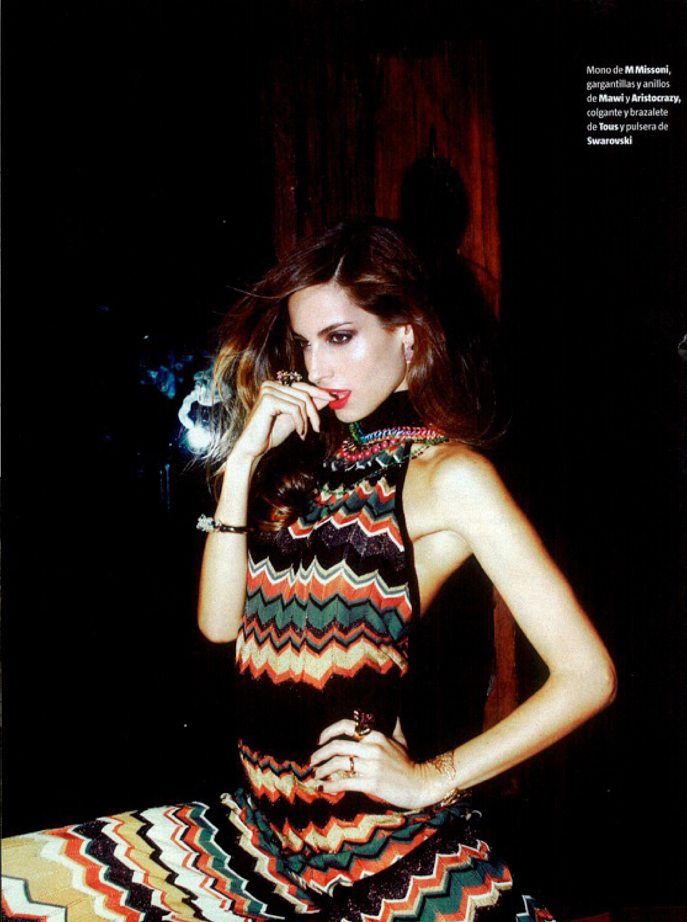
Mono de M Missoni , gargantillas y anillos de Mawi y Aristocrazy , colgante y brazalete de Tous y pulsera de Swarovski