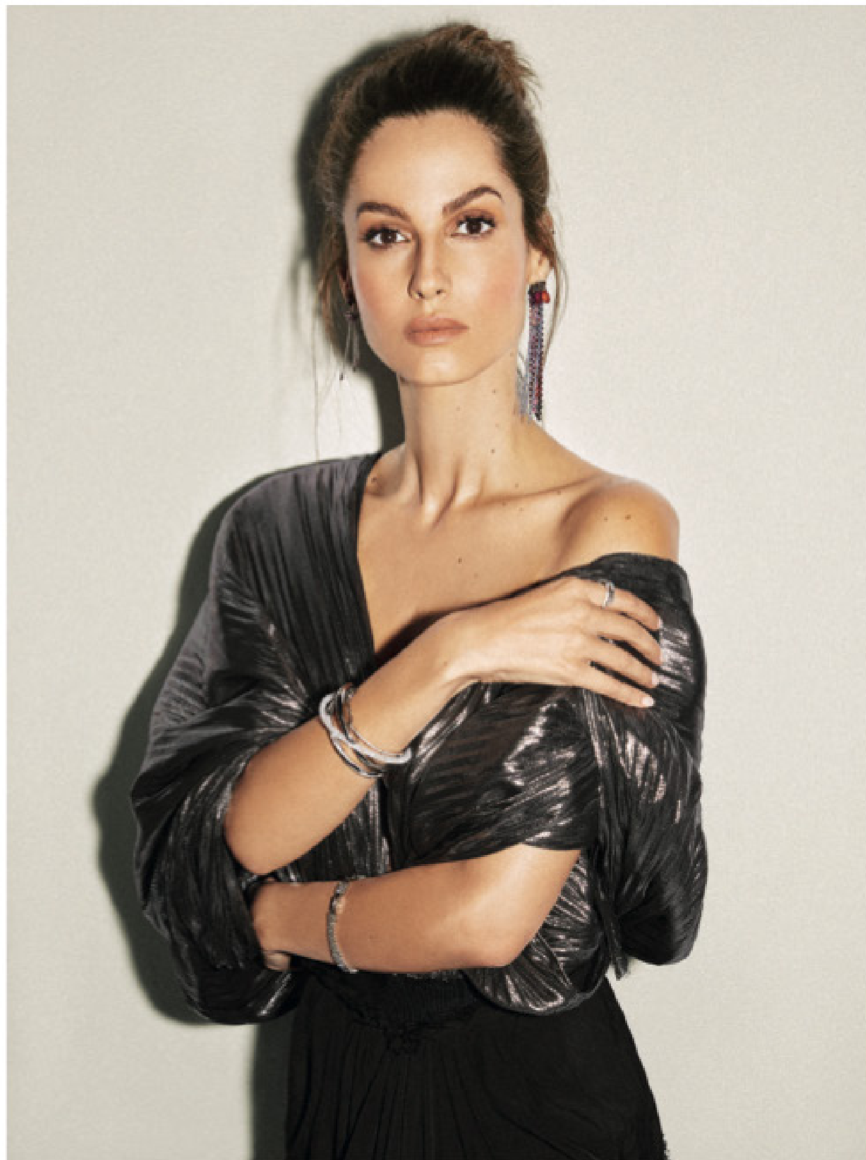
Ariadne, con vestido de 'lurex' plisado de LOEWE . En la oreja izquierda luce un pendiente Haute Couture; en la derecha, un pendiente Hearty. En el brazo derecho, pulseras Crystaldust Cross y Henrietta; en el izquierdo, pulsera Fit Bracelet. Todo, incluido el anillo Sparkling Dance, es de SWAROVSKI . La piel se ha perfeccionado con el maquillaje Maestro Foundation, y el acabado mate de los labios se consiguió con el labial Lip Magnet nº 505. Ambos de Giorgio Armani Beauty .