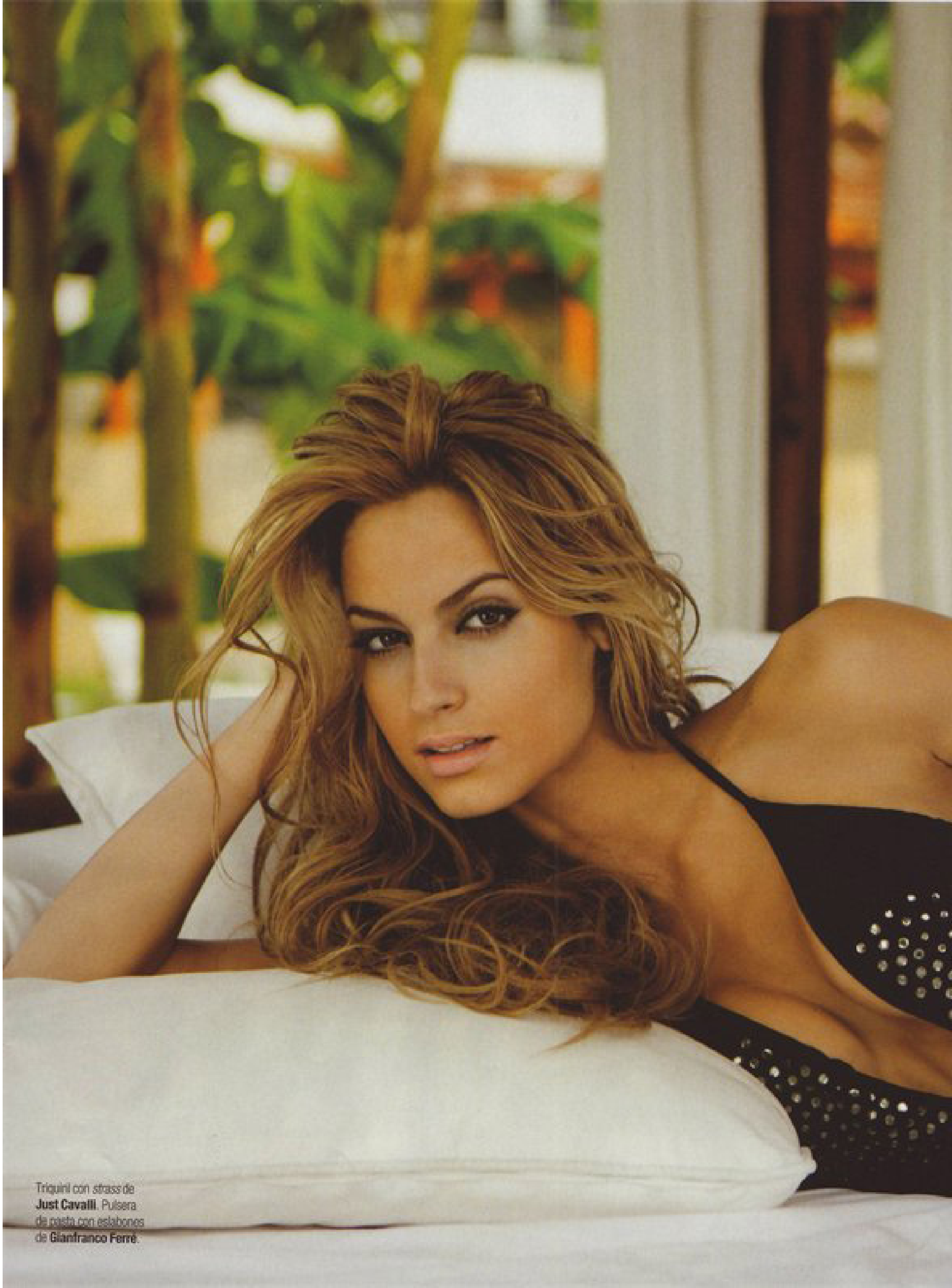
Triquini con strass de Just Cavalli. Pulsera de pasta con eslabones de Gianfranco Ferré.