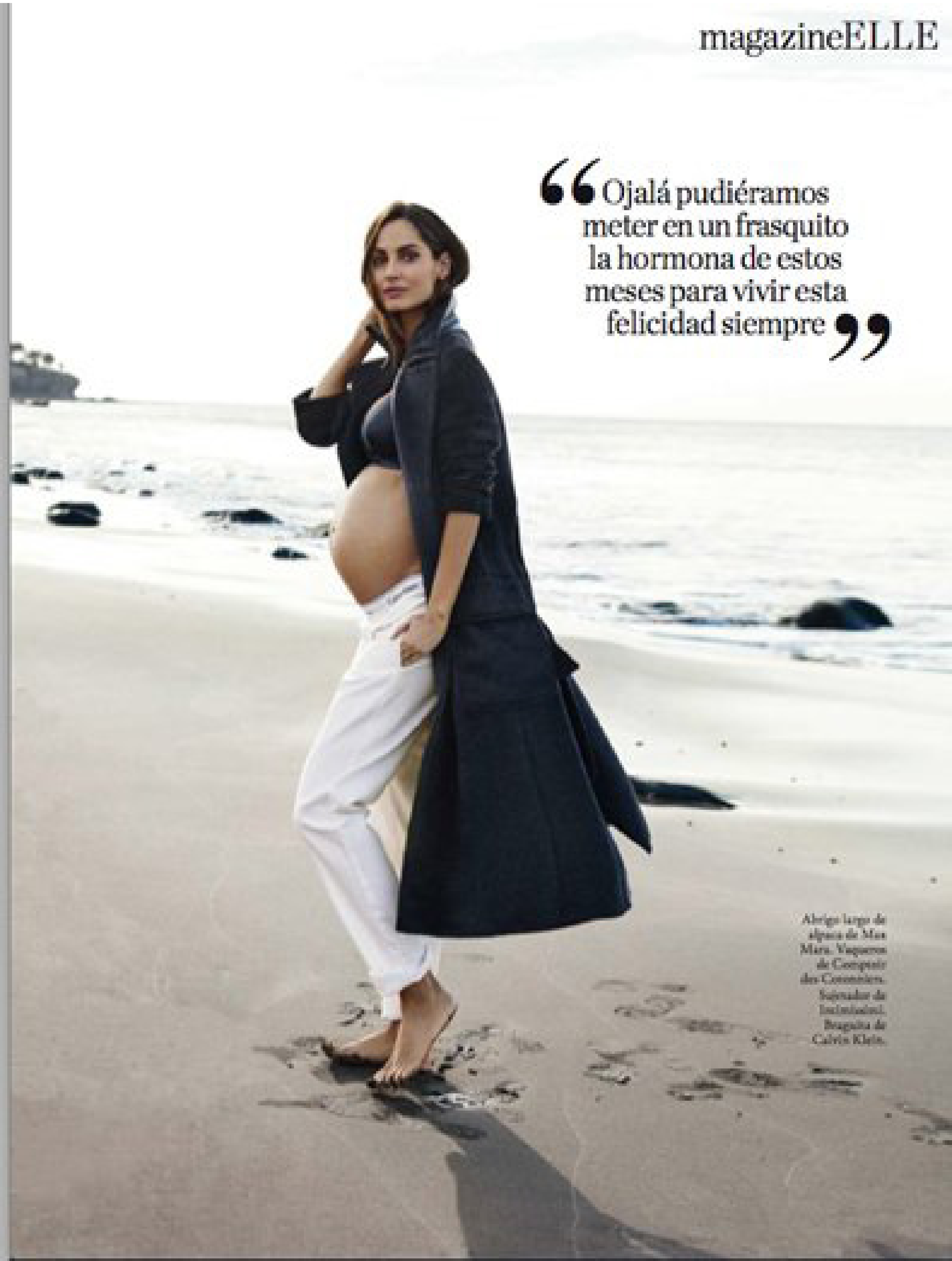
Abrigo largo de alpaca de Mia Mira. Vaqueros de Comptoir des Cotonniers. Sujetador de Incubated. Braguita de Calvin Klein.

“ Ojalá pudiéramos meter en un frasquito la hormona de estos meses para vivir esta felicidad siempre ”